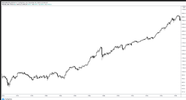
DOW JONES INDUSTRIAL AVERAGE Monatlicher Chart 1973 bis 1989

Technische Muster / das Verhältnis von Angebot und Nachfrage zeigt sich in allen Zeiteinheiten. In sehr kleinen Zeiteinheit herrscht jedoch ein höheres "Marktrauschen" eine "Randomness" des Marktes.