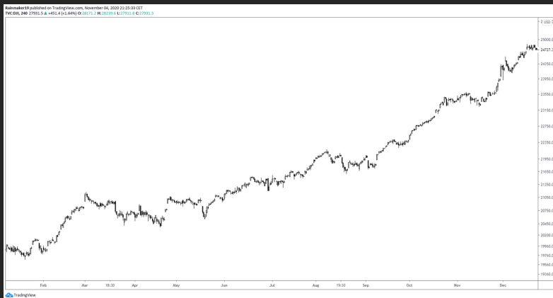
DOW JONES INDUSTRIAL AVERAGE Vier-Stunden Chart Januar bis Dezember 2017

FUNKTIONIERT TECHNISCHE ANALYSE NUR KURZFRISTIG?